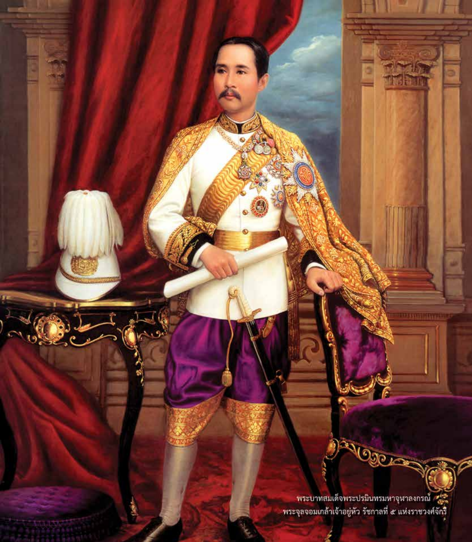
พระบาทสมเด็จพระปรมินทรมหาจุฬาลงกรณ์ พระจุลจอมเกล้าเจ้าอยู่หัว รัชกาลที่ ๕ แห่งราชวงศ์จักรี